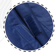
TAPETA CUBRE CIERRE